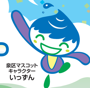
泉区マスコットキャラクター いっずん