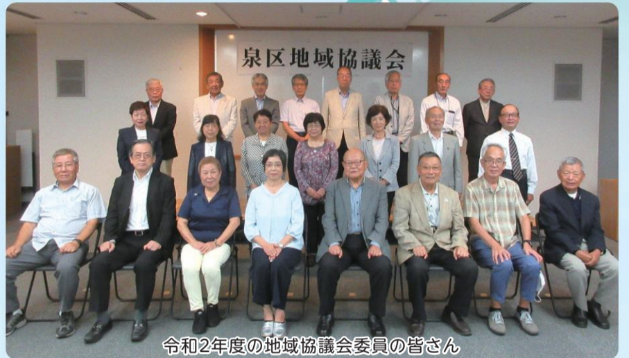
令和2年度の地域協議会委員の皆さん

地域協議会には平成26年度から委員として参加し、昨年度から会長を務めています。今後も他地区の事例を参考にし、委員の皆さんと出合った意見をそれぞれの活動に反映させることで、泉区全体が活気あるまちになればいいと思います。泉区に住んでよかった、ずっと住み続けたいと思ってもらえることを目標に頑張っています。