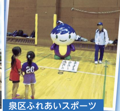
泉区ふれあいスポーツ

泉区民ふれあいまつりでは、スタンプラリー形式の軽スポーツコーナーを設けて、多くの子どもたちに実際に体験してもらい、スポーツの楽しさを伝えています。