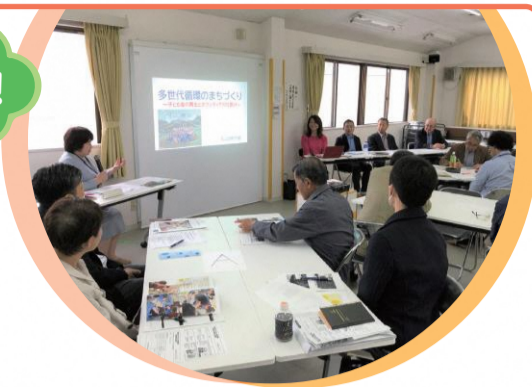
現地見学会の様子(昨年度)

なお、開催にあたっては、新型コロナウイルス感染症対策を十分に行い、各プログラムを実施します。