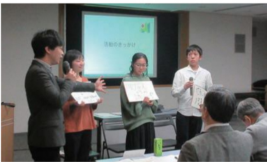
アクションポート横浜の皆さんによる事例紹介の様子

令和元年度は、新しい取組として、NPO法人アクションポート横浜*と地域協議会との意見交換の場を設けました。