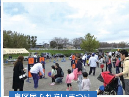
泉区民ふれあいまつり

一部の地区にて7月から8月にかけて、小学校のプールで水泳教室を開催し、子どもたちの成長を応援しています。