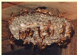
アシナガバチの巣

区役所では、ハチの駆除は行っていませんが、スズメバチやアシナガバチなどの駆除方法の案内をしています。また、アシナガバチの巣を駆除するための機材の貸出しを行っています。