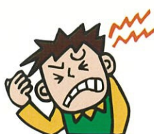
いたい I feel pain