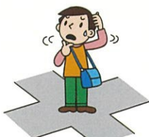
まいごになった I am lost