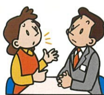
そらだん 相談したい I'd like a consultaion