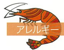
アレルギー shrimp allergy