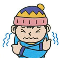
さむい I feel cold