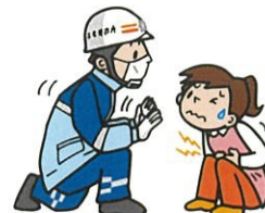
すこし待ってください Please wait for a moment