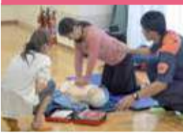
心肺蘇生法及びAEDの取扱い