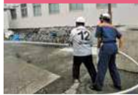
初期消火器具を使って初期消火