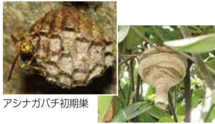
アシナガバチ初期巣

ハチは巣を守るために人を刺します。夏季に区役所に相談が多いアシナガバチ・スズメバチの巣は、毎年4月頃から女王バチ1匹で作り始める1年限りの巣です。暖かくなるにつれ働きバチが増え、巣もどんどん大きくなり、9月頃最大になります。秋には翌年の女王バチが生まれ、朽木や落ち葉の下で越冬します。働きバチは越冬しません。