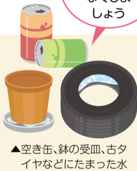
▲空き缶、鉢の受皿、古タイヤなどにたまった水

成虫対策: やぶや草むら、低木の中など風通しが悪く湿った場所に潜んでいるため、定期的な草刈りや剪定で風通しを良くし、潜み場所をなくしましょう。