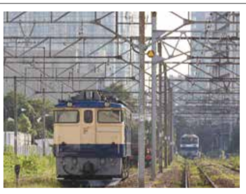
(撮影地 東高島駅付近)