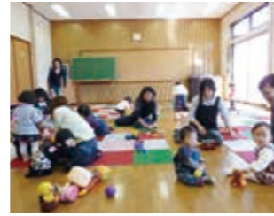
フリースペースころころ