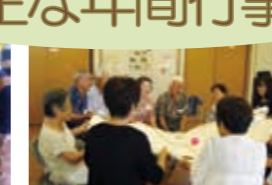
認知症予防スリーA講座