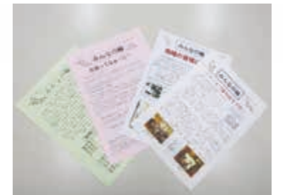
広報誌・みんなの輪