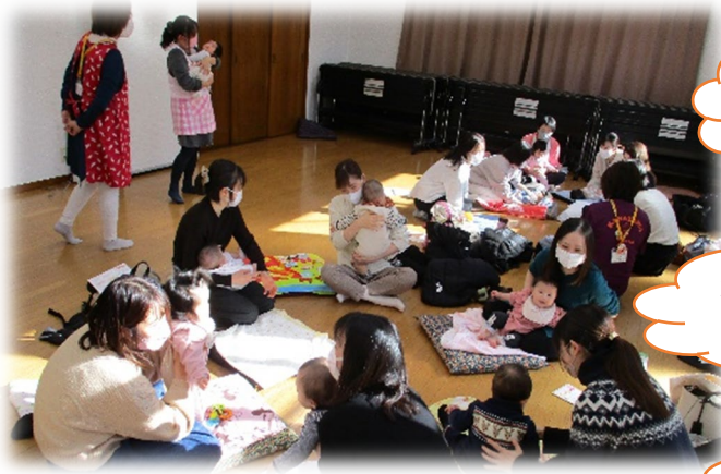
情報交換 ～お子さんの最近の様子や遊び場情報について お話しをしています～