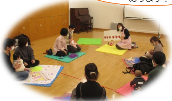
大きい絵本の読み聞かせ