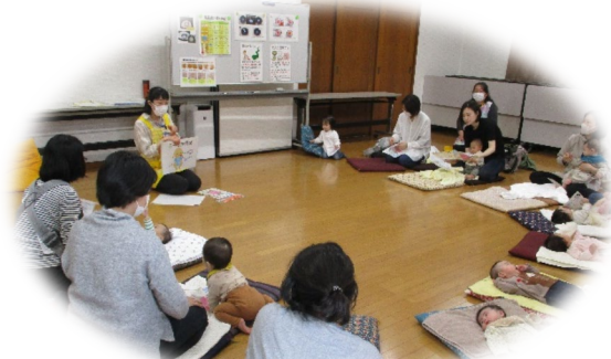
離乳食のお話の様子