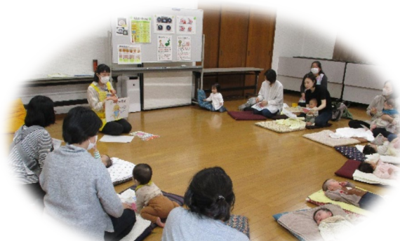
離乳食のお話の様子