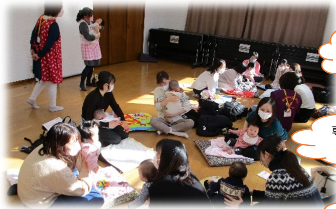
情報交換 ～お子さんの最近の様子や遊び場情報について お話しをしています～