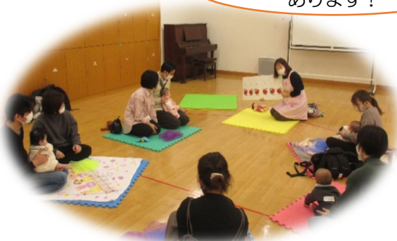
大きい絵本の読み聞かせ