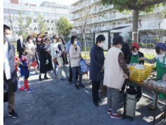
模擬店はソーシャルディスタンスを守って…盛況でした！