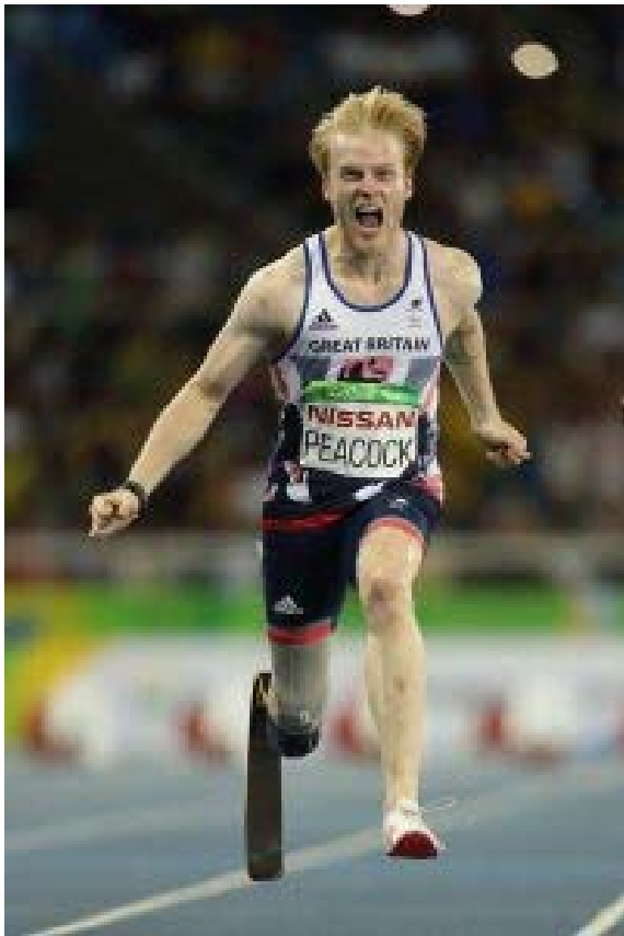
リオ 2016 大会で優勝したジョニー・ピーコック

映画では、英国のパラリンピアン、ジョニー・ピーコック（陸上 100m T44）選手の半生が紹介されています。彼は 19 歳の時に出場したロンドン 2012 大会で、大観衆の中、金メダルを獲得した英国のスターの 1 人であり、さらには 4 年後のリオ 2016 大会でも金メダルを獲得しています。100m を 10 秒台で疾走するピーコック選手は、東京 2020 大会での 3 連覇が期待されています。