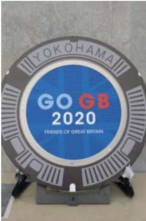
【横浜国際プールに展示したレプリカ】

コロナの影響に伴い、選手のみなさんは公共交通機関も利用できないため、直接見ていただくことはできませんでしたが、横浜国際プールの練習会場内にレプリカを展示し、英国選手団の皆様にご覧いただきました。