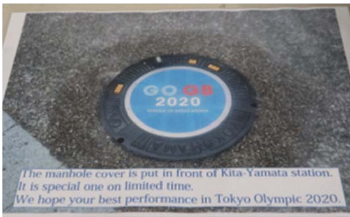
【英語の説明も添えて】