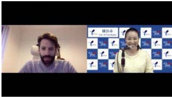
▲当日のオンラインセミナーの様子