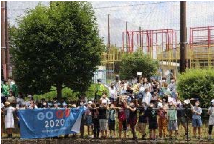
GO GB の旗を手に元気にお見送り