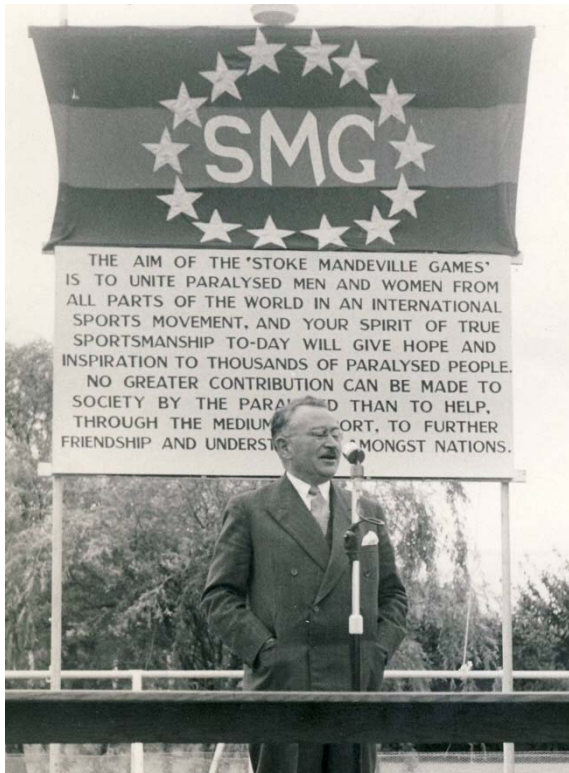
ストーク・マンデヴィル競技大会で挨拶をするグットマン博士

パラリンピックは、1948年に英国のストーク・マンデヴィルで行われた、負傷兵士による車いす競技大会が発祥とされています。第二次世界大戦で傷を負った兵士たちのリハビリを目的として、スポーツを推奨した医師、ルードヴィヒ・グットマン博士は「パラリンピックの父」と呼ばれています。『ライジング・フェニックス：パラリンピックと人間の可能性』では、グットマン博士の娘が登場し、父親である博士との思い出を語ります。