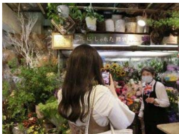
写真：日吉商店街の花屋さんでの動画の撮影風景

英国代表チームの事前キャンプがいよいよ始まりました！横浜市港北区では、慶應義塾大学で滞在サポートを行う学生プロジェクト KEIO2020project と共に、感染症対策を徹底しながら、英国代表チーム応援動画を制作しています。