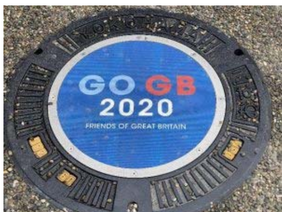
【北山田駅前広場に設置されたデザインマンホール】

区民一同、東京 2020 大会に向けて練習をしている英国水泳選手の皆様にエール送ります。