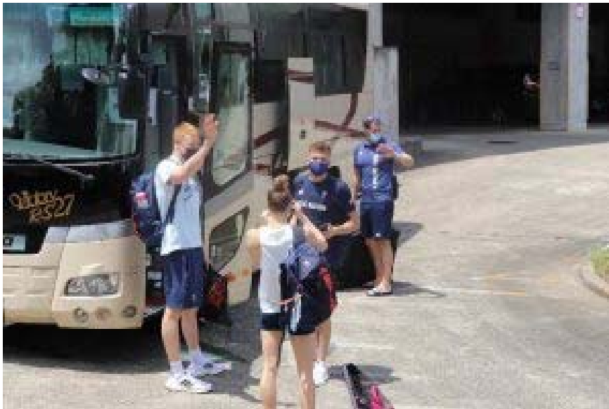
声援に応える選手のみなさん

選手を見送った子どもたちは、短い時間でしたがオリンピック代表選手を間近に見る貴重な機会に興奮していました。