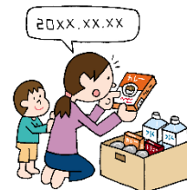
備蓄品の確認・更新

お問合せ 港北区総務課防災担当 TEL:045-540-2206 FAX:045-540-2209