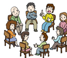
<自治会・町内会館で>