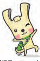
市資源循環局マスコット イーオ

家庭で使い切れない未使用食品を区で集め、港北区社会福祉協議会を通じて、地域の福祉施設や食品を必要としている人に無償で寄贈しているよ。