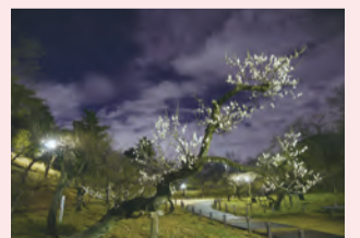
2023年最優秀賞「昇龍梅」