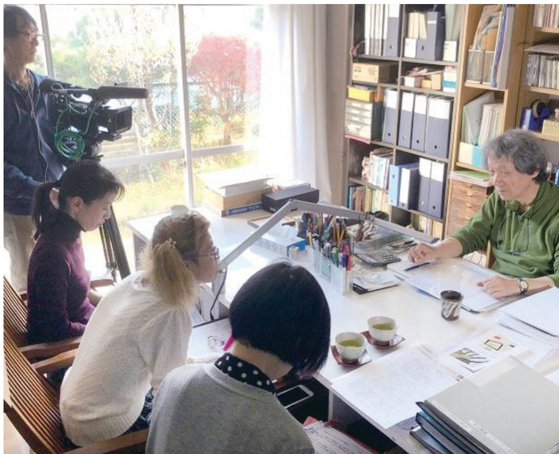
「わがまち港北映像プロジェクト」による取材・撮影の様子