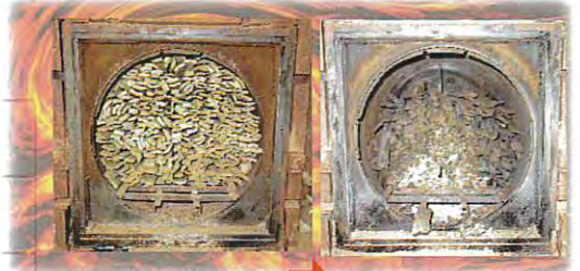
8日(土) 窯づめ → 22日(土) 窯出し