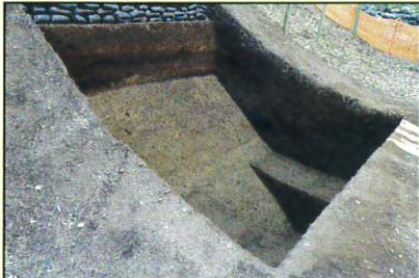
北空堀調査区(令和3年度調査)

小机城跡に関しては、これまで体系的な調査報告がなされてきませんでした。令和3・4年度に調査主体・横浜市教育委員会、調査支援・公益財団法人横浜市ふるさと歴史財団埋蔵文化財センターとして発掘調査が行われました。