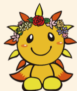
旭区マスコットキャラクター あさひくん