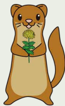
栄区いち川マスコット タッチーくん