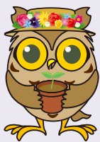
瀬谷区マスコットキャラクター 「せやまる」