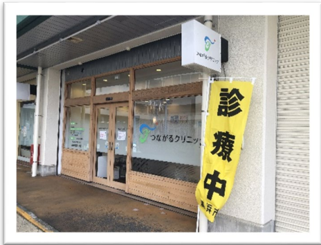
つながるクリニック