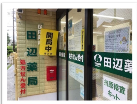
田辺薬局港南中央店