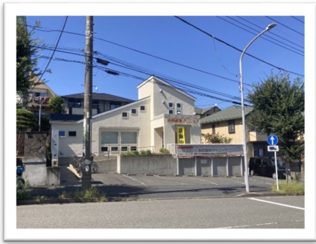
吉田歯科クリニック