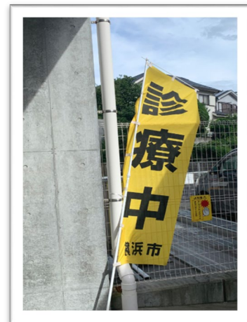
秋山脳神経外科病院