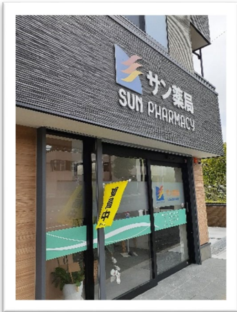
サン薬局南部在宅療養支援部