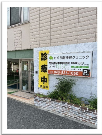
たぐち脳神経クリニック