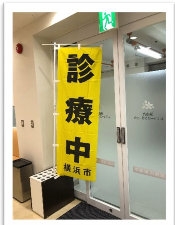
港南台レディースクリニック