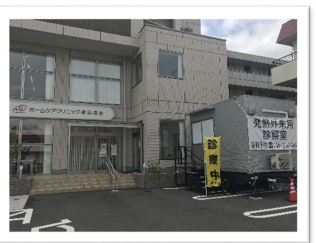
上永谷さいとうクリニック