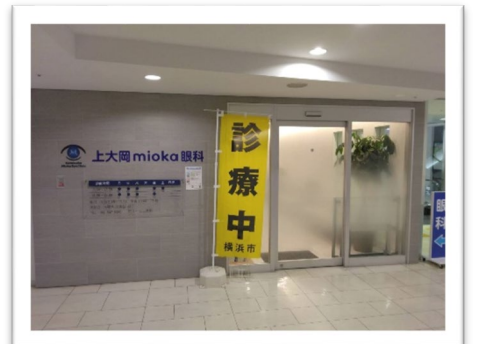
上大岡 mioka 眼科