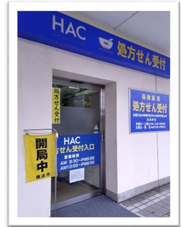
ハックドラッグ港南台パーズI薬局