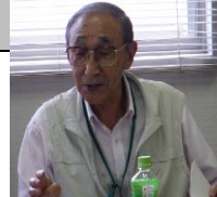
小玉委員 野庭団地