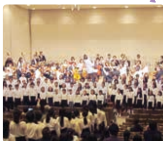
全出演者による圧巻のステージ

港南台第二・野庭すずかけ・日野南・桜岡・下永谷小学校と、特別出演の港南区ひまわり管弦楽団が、合唱と演奏を披露しました。小学生と管弦楽団のコラボレーション発表には、約600人の観衆が魅了されました。