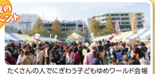
たくさんの人でにぎわう子どもゆめワールド会場