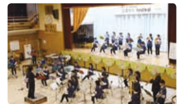
中学生による記念イベントも人気。ステージ発表とお茶席