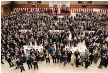
参加者全員でハートマークをつくって記念撮影

総勢732人が参加する賀詞交換会が開催され、和太鼓演奏や獅子舞の披露などで、50周年イヤーが盛大に幕を開けました。