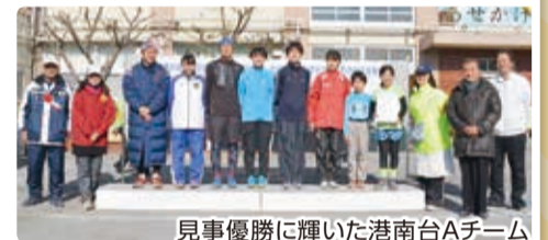
見事優勝に輝いた港南台Aチーム