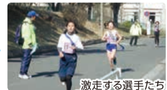
激走する選手たち

50周年記念最初のイベントは、連合町内会交流駅伝。小学生からシニアまで15連合18チーム144人の選手が一丸となって、たすきをつなぎました。