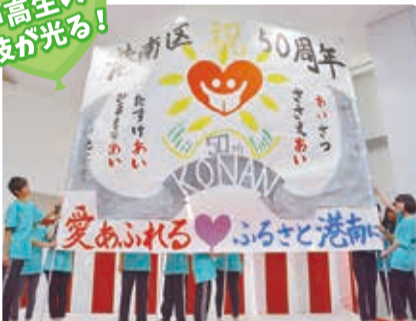
書道作品が披露されると称賛の声が