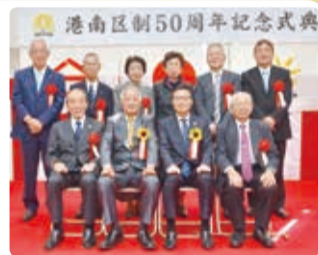
各分野の功労者の皆さん

約150人が出席し、50周年記念式典が開催され、永年、地域に貢献された皆さんの表彰などが行われました。