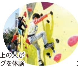
1,000人以上の人がボルダリングを体験