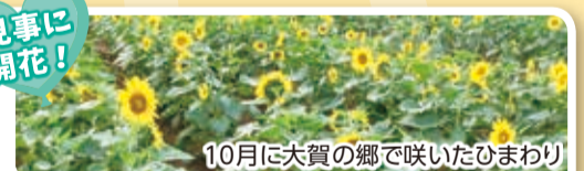
10月に大賀の郷で咲いたひまわり