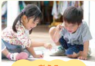
考える 試す・工夫する