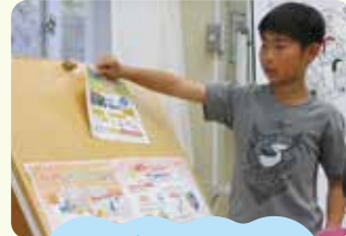
学びに向かう力 人間性など

「幼児期の終わりまでに育ってほしい姿」を手がかりに、 園と学校双方の子どもの成長の様子や手立てなどについての 相互理解や協働を目指します。（「幼保小の架け橋プログラム」の実施）