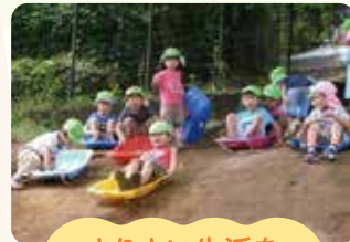
よりよい生活を 営もうとする