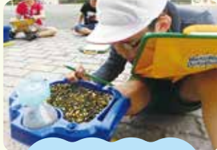
思考力・判断力 表現力など