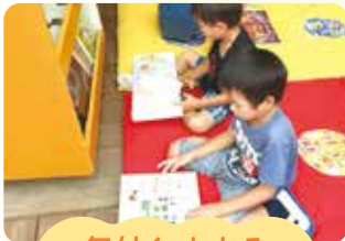
気付く・わかる やってみようとする