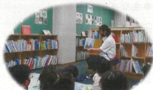
夏のこわいおはなし会風景

夏にぴったりのこわいおはなし会や、夜のおはなし会など、いつもと違うおはなし会に参加してみませんか。