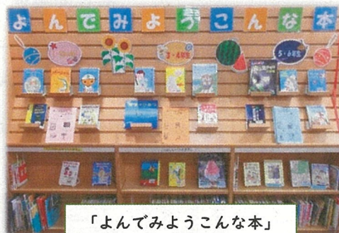
「よんでみようこんな本」 展示風景