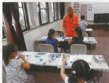
図書館 de YES (エコスクール) 「マイクロプラスチックで万華鏡」

夏休みの宿題や自由研究など、調べもののお手伝いや読書相談など、図書館の使い方が楽しく学べます。