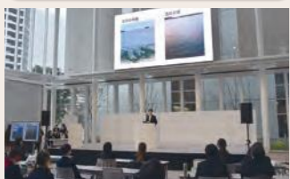
課題探究発表会の様子