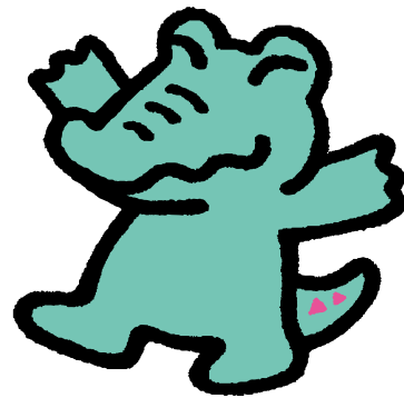
鶴見区マスコット ワックン

そうした課題解決につながるような読書活動に関する講座・イベント等の開催や、資料・情報の収集・提供協力を通し、人と人とのつながりづくりを促進します。