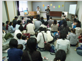
図書館で読み聞かせ活動をしている4団体合同のおはなし大会、「おはなしいっぱい」会の開催、本の紹介、活動へのアドバイスなどを行っています。

小中学校をはじめ、子育て支援拠点・保育園等さまざまな施設で、たくさんのボランティアが活動しています。図書館でも、4つのボランティア団体がおはなし会を開催しています。港南図書館では、こうしたボランティアや施設に対して、講習会やボランティア交流会の開催、本の紹介、活動へのアドバイスなどを行っています。