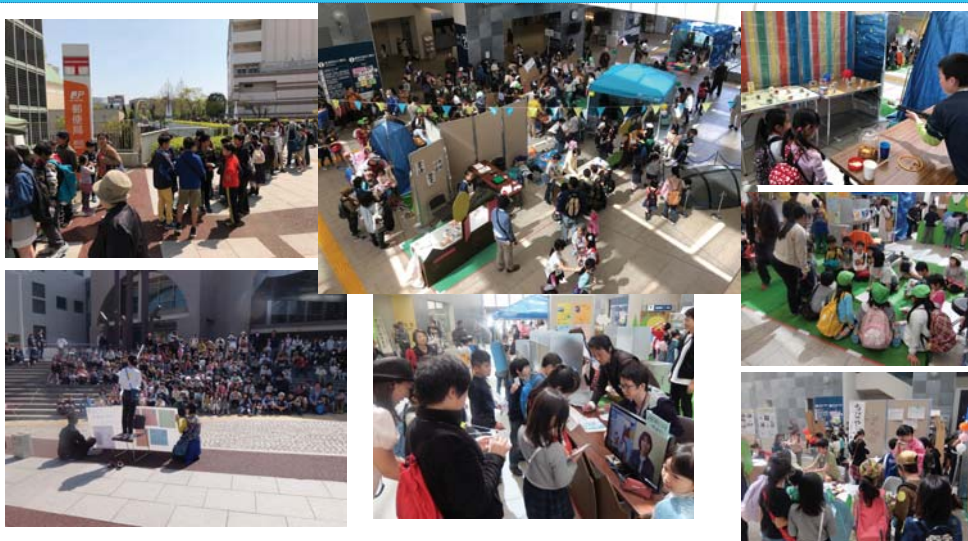
都筑区総合庁舎で開催、区役所、警察、消防、図書館、郵便局等と連携