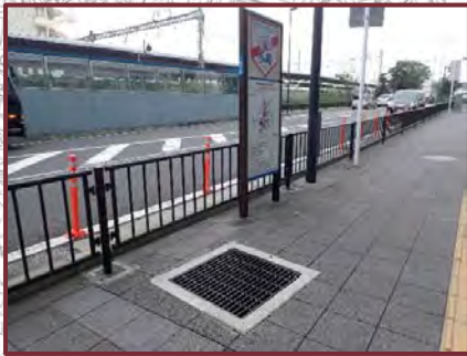
【戸塚区役所周辺の道路】 ●車いすや白杖がはまらないように グレーチングの改修