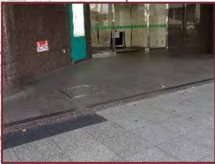
【戸塚駅東口駅前広場】 ●駅前広場とビル入口の段差の解消