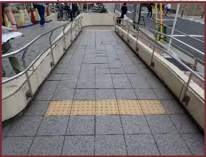
【戸塚地区センター・戸塚図書館・戸塚公会堂】 ◆滑りにくいスロープへの改善