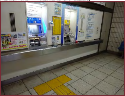
【地下鉄戸塚駅】 ◆車いすの方の膝がぶつからないようにするなど、 障害者等の利用に適した券売機の設置