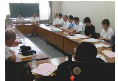
土浦市の担当者も参加した勉強会

土浦市では、バリアフリー新法に基づく住民提案制度ができる前から、市民団体がまちのバリアフリー化に向けた取組みを進めていました。電車やバスの乗車点検、シンポジウム、勉強会などを経て作成されたバリアフリー基本構想（素案）が、平成 19 年 7 月に市へ提案されました。