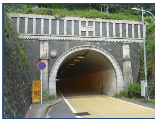
東隧道(保土ヶ谷区)