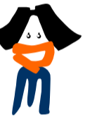
河川部マスコット 「ハマカワさん」