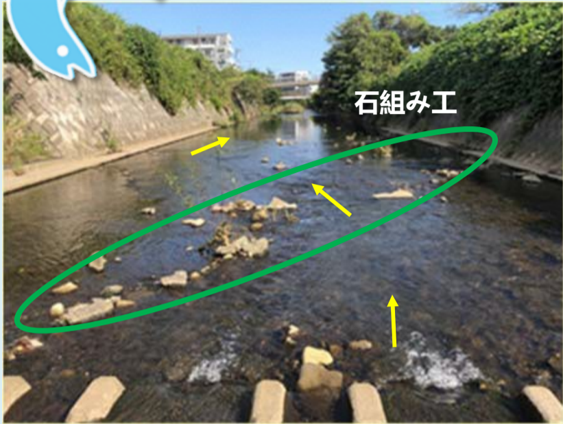
蛇行する流れをつくる石組み工（帷子川）

流れに変化がある川づくりや簡易魚道など、魚類の生息環境の改善はちょっとした工夫で実施できるものもあります。ご近所の川で実施できないか考えてみませんか？