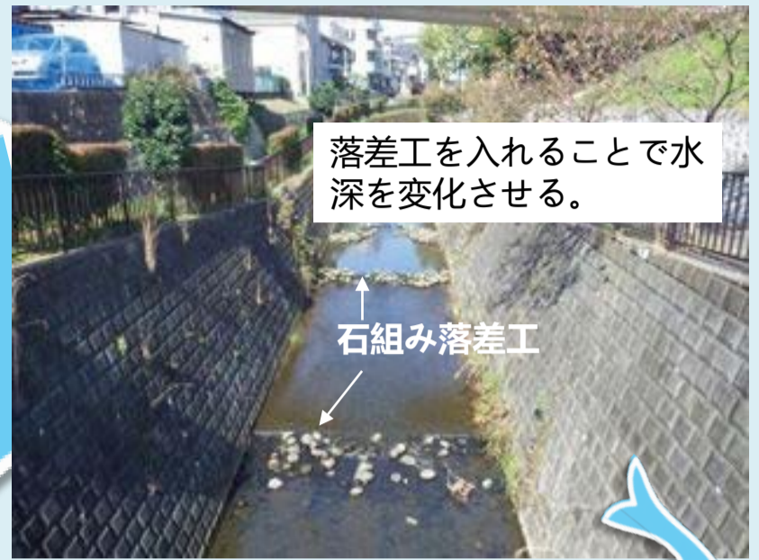
水深に変化をつける石組み落差工（黒須田川）