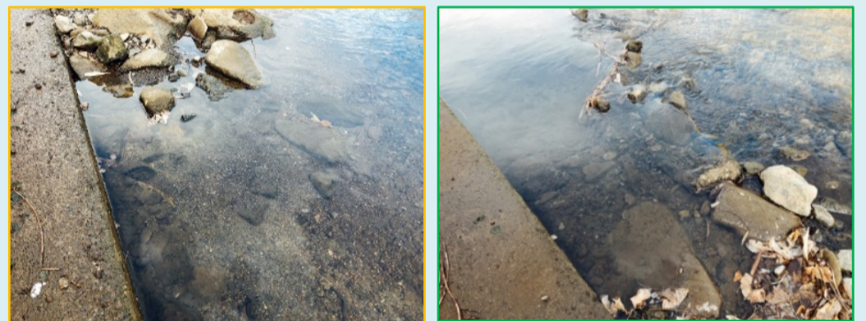
半割コルゲート管を利用した魚道