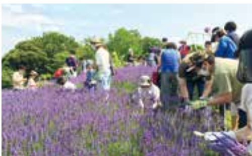
地域で取り組む緑化活動

GREEN×EXPO 2027の開催も見据え、多くの人が訪れる市街地や、生活に身近な住宅地などでの緑や花の創出、育成を進めます。