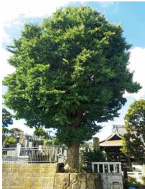
名木古木に指定された樹木

また、指定木の維持管理に必要な樹木の診断や治療及びせん定等の維持管理費用の一部を助成します。