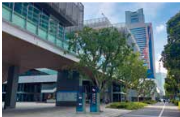
公開性のある場所での緑化

多くの人を訪れる公開性のある民有地において、法令等で定める基準以上の緑化を行う市民・事業者に対し、その費用の一部を助成します。