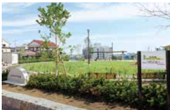
公有地化によるシンボリックな緑の創出・育成

また、花畑や名所など、地域に親しまれている緑のオープンスペースが、所有者の不測の事態等により、存続が困難となる場合に用地を取得し、緑や花による地域のシンボリックな空間として保全し、良好に育成します。