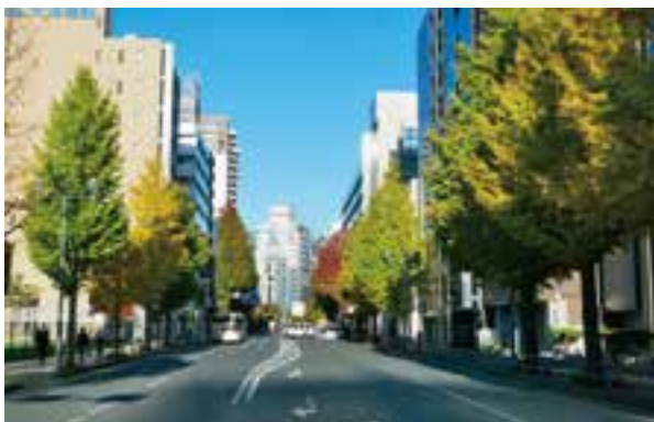
街路樹による良好な景観

駅周辺や各区の主要な路線を中心に、多くの市民の目にふれ、街並みの美観向上に寄与する街路樹を良好に育成します。また、地域で愛されている桜並木等の再生を行います。これらを通して街路樹による良好な景観づくりを進めます。