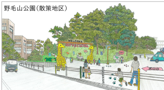
ワクワク感が高まるゲートや動物型オブジェの整備 など