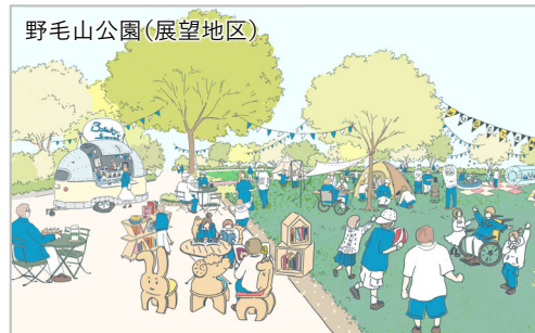
大人から子どもまで楽しめるマルシェやワークショップ等の開催 など