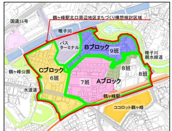
図1：鶴ヶ峰駅北口周辺地区まちづくり構想検討区域図