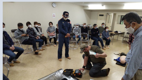
◀ 防災訓練 (AED警報音 確認テスト)