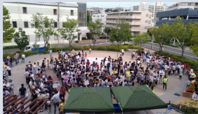
▲防災訓練の様子（毎年8割近くの住民が参加）