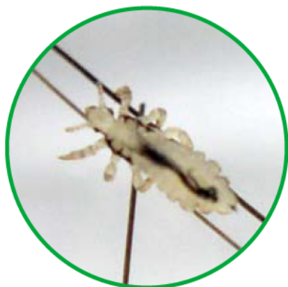
アタマジラミの成虫(約3mm)

人の頭に寄生し、頭皮から吸血します。吸血された箇所がかゆくなります。幼虫、成虫ともに吸血します。吸血しないと、3日ぐらいで死んでしまいます。