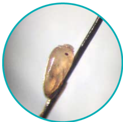
アタマジラミの卵(約0.8mm)

毛にうみつけれられた卵を探してください。卵は耳の後ろや後頭部に多く見られ毛の根本付近に付いていることが多いです。