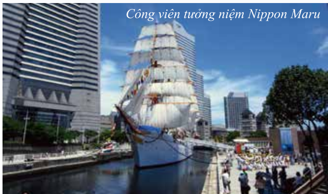
Công viên tưởng niệm Nippon Maru

Công viên tưởng niệm Nippon Maru , bến tàu cổ nhất cả nước được khôi phục thành công viên cây xanh có một chiếc thuyền buồm – tàu Nippon Maru.