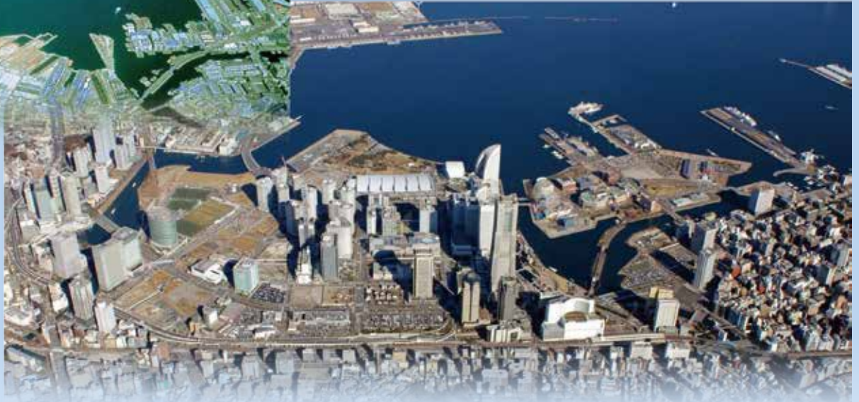
Toàn cảnh Minato Mirai 21 năm 2013