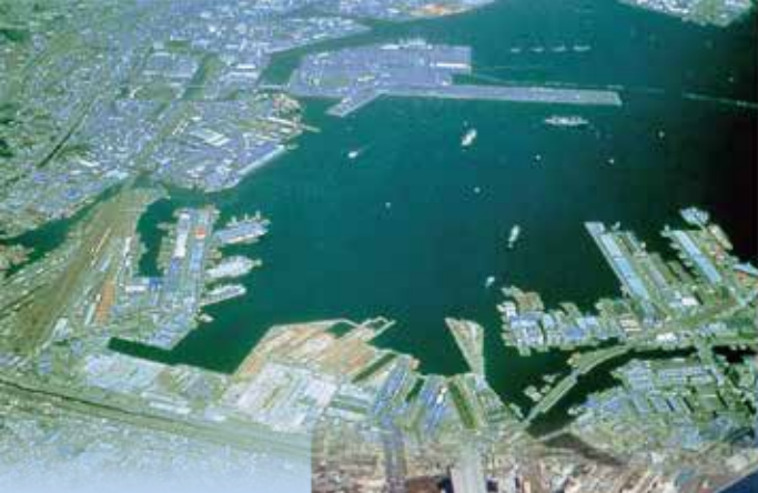
Toàn cảnh Minato Mirai 21 năm 1983