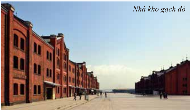
Nhà kho gạch đỏ

Nhà kho gạch đỏ , trước đây là bưu điện giờ được sử dụng làm siêu thị. Đã được nhận giải thưởng Di sản Châu Á- Thái Bình Dương của UNESCO về bảo tồn di sản văn hóa năm 2010.