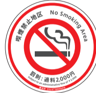
この道路マークが目じるしです