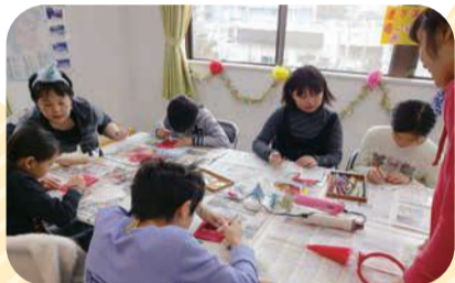
▲子ども会の楽しいイベント

親子で集まれる子育てサロン や子ども会の活動をとおして、 地域全体で子育て支援をしています。 安心して子育てできるまち づくりにとりこんでいます。