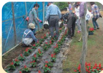
▲町内の花だんに花を植える

歩道の花だんに美しい花を植え たり、落ち葉のそうじをして、まちを きれいにしています。ごみ集積場所 を維持・管理したり、古い紙や布など 資源ごみを回収したりする自治会 町内会もあります。