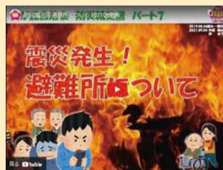
▲実際の防災紙芝居の動画