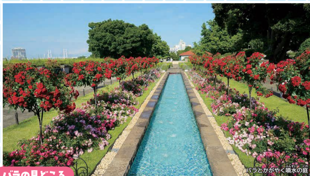
バラとかがやく噴水の庭