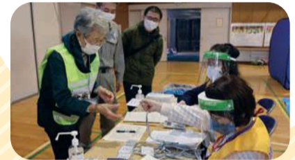
▲コロナ流行の中での防災訓練

自治会町内会では、災害がおきたときの ことを考えて、必要なものを備蓄したり、 防災訓練をしたりします。いざという時こ そ、地域のつながりが力を発揮します。