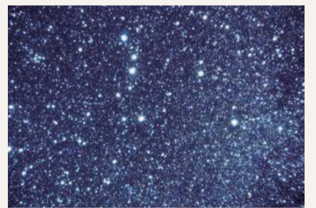
▲プラネタリウムで見る星空

Most stars projected by a planetarium projector (one off) 認定日:2023年2月8日(水) YOKOHAMA SCIENCE CENTER