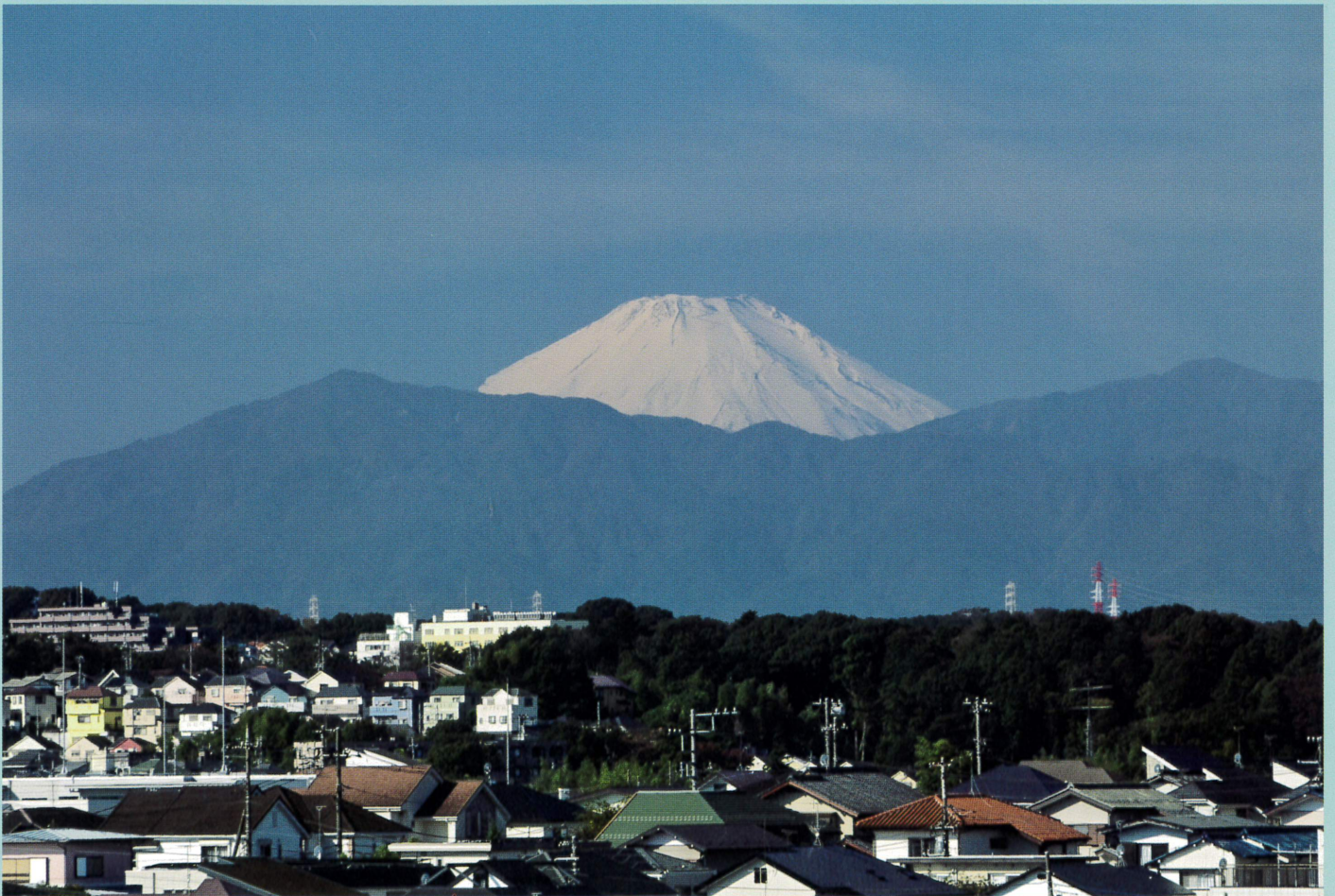
撮影 荒川忠明さん(東本郷5丁目在住) 東本郷第一公園より撮影

東本郷地区は、昭和40年代から計画的に開発された戸建てを中心としたまちです。少子高齢化が進行し、小学校の児童数は15年前から半減しています。また、高齢化率も約30%となっており、中でも東本郷2・3丁目の高齢化率が特に高く、50%に迫りつつあります。一方で、従来から多くのボランティア団体・グループや趣味サークルなど、住民による活動がとても盛んです。活動を通じて、住民同士のつながりづくりができてきていることは、東本郷地区の大きな特徴のひとつです。