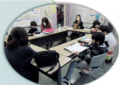
▲よりみち学習広場