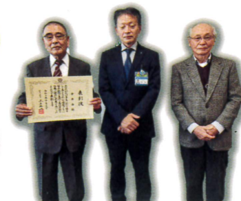
▲神奈川県知事より美化運動推進功労者表彰

「街をきれいに住んで良かった東本郷」 城中生徒達も頑張っています 皆様ありがとうございます