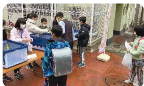
フードドライブの様子

3月6日(月)~8日(水)に5年1組の児童が中心になって実施しました。合計151点の食品が集まりました。集まった食品は、緑区社会福祉協議会へお渡ししました。