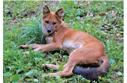
▲きれいな赤茶色の毛並み