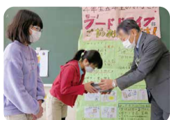
集まった食品の贈呈式の様子