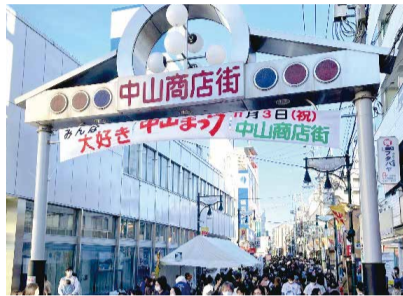
▲中山まつりアーチ

中山駅周辺に約150店舗で形成される区内最大級の商店街です。11月3日に開催される中山まつりでは、多くの人出でより一層のにぎわいを見せます。また、商店街からは自然豊かな県立四季の森公園まで徒歩圏内であるほか、よこはま動物園ズーラシアへのアクセスポイントとなっています。