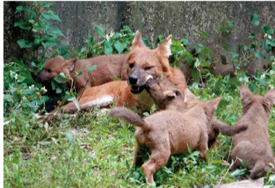
▲父親に甘える子どもたち

3月2日にオスのケーシーとメスのモーアの間赤ちゃんが生まれました。当園で繁殖に成功したのは18年ぶりです。親子6頭の群れを当園で展示しています。お互いがじゃれあう姿も頻繁に見られ、ドールのパックの強い絆を感じることができます。