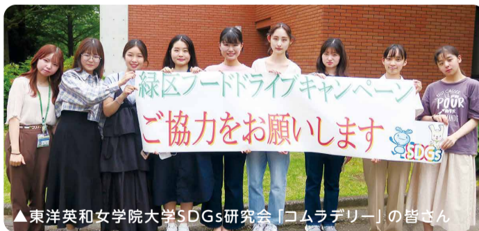
▲東洋英和女学院大学SDGs研究会「コムラデリー」の皆さん

10月15日(日)に開催される緑区民まつりで、東洋英和女学院大学SDGs研究会「コムラデリー」の皆さんと一緒にフードドライブを実施します。