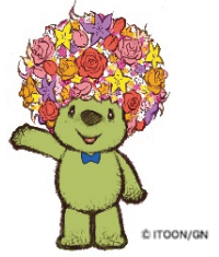
横浜の花と緑をPRする マスコットキャラクター 「ガーデンベア」