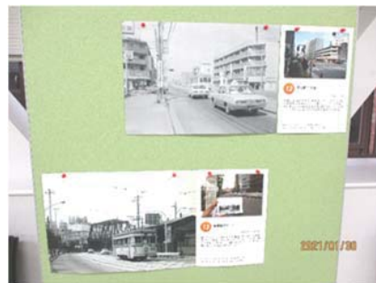
横浜の街の変遷が一目瞭然

模型は迫力のHOゲージ。1960~70年代の元町付近をイメージしたレイアウトに、横浜市電を走らせました。