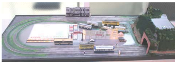
麦田のトンネル付近の模型展示

市電が走った街の昔と今の定点写真と、市電模型の展示会を開催しました。関東大震災前に山手にあった、麒麟ビール工場の引込線の調査結果のパネル展示や、デジタルアーカイブでの「しでんマップ」の公開も。