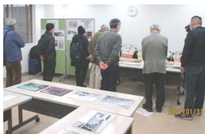
熱心に展示に見入る来場者

模型は迫力のHOゲージ。1960~70年代の元町付近をイメージしたレイアウトに、横浜市電を走らせました。