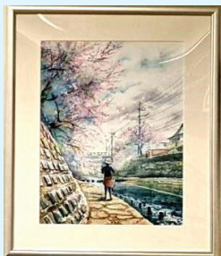
5月 本牧スケッチ会