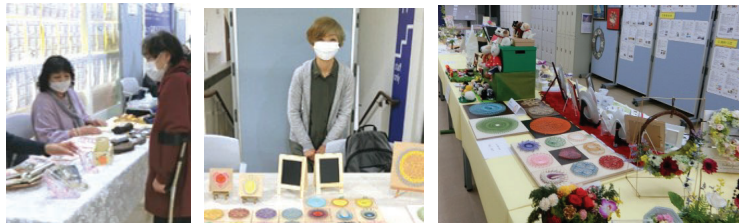
↑チャリティの作品販売も行いました