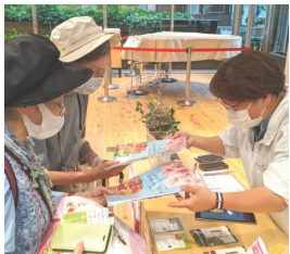
↑素敵な景品に喜び参加者

方などのガイドを行いました。天気もよく、景色や花を楽しみ、写真の撮り方のコツも学びながら、全員がスタンプラリーのビンゴ景品をもらうことが出来ました。