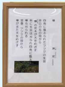
6月 横浜詩誌交流会