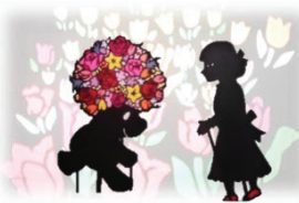
↑本牧影絵座の上演 ↓エコバッグぬりえ

前日までは雨予報でしたが、直前に予報が変り2日間とも雨が降ることなく開催できて、多くの来場者の方々に楽しんでいただけました。