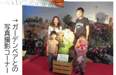
→ガーデンベアとの写真撮影コーナー