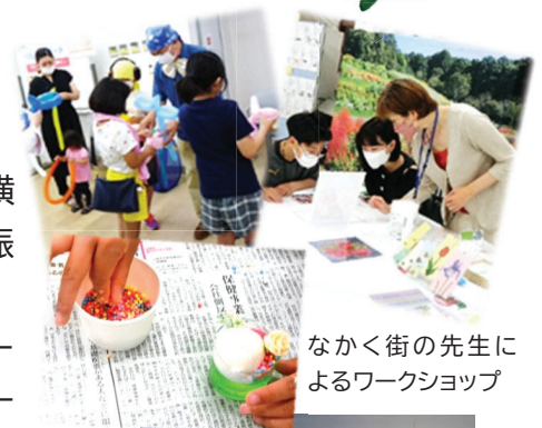
なかく街の先生によるワークショップ