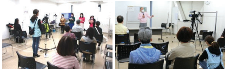
↑撮影したミニ講座等の動画は、なか区民活動センターHPで順次公開します

◆ ミーティングエリアでは、花や絵画、書道など12名の作品を展示し、ロビーでは作品展示者8人による販売を行い、売り上げの一部は赤十字社に寄付しました。