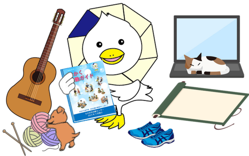
なか区民活動センターマスコット もなか