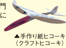
▲手作り紙ヒコーキ(クラフトヒコーキ)

地域の人と子どもたちが一緒に紙ヒコーキを製作し、3部門(小学3年生以下、小学4～6年生、中学生以上・一般)に分かれて紙ヒコーキの飛行時間を競い合うイベントです 問 西区青少年指導員協議会(地域振興課内) ☎320-8391 fax322-9535