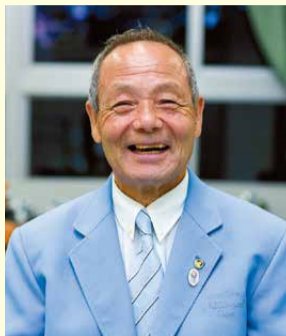
東京国際大学 ウエイトリフティング部監督

東京・メキシコシティと2大会連続でオリンピック金メダルに輝いた、重量挙げ選手の三宅義信氏が西区で講演を行います。今回の講演では、4度出場したオリンピックと共に歩んだ人生について語ります。