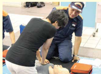
救急の知識は大切な人を守る