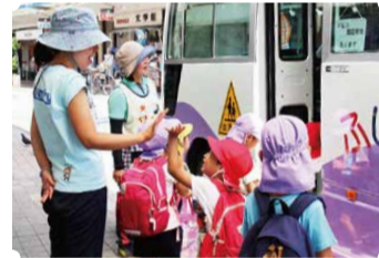
お友だちも一緒に安心

巡回ルートは園によって違いがありますが、大半は区内の広範囲をカバーしています。「遠いから」とあきらめずに、まずは通園バスの有無を幼稚園に確認し、無理のない範囲で通園を検討してみてください。