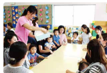
親子と一緒に「はじめまして」

未就園児対象の幼稚園体験を利用して、お子さんが早くから集団生活を体験できます。週1回から利用できる園もあります。