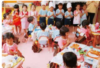
おもてなしも成長の証 (レストランの日)

お弁当は月に2回だけという園もあります。また、食育を大事にした、旬の野菜を使った料理が出る「野菜デー」やコック帽やエプロンをつける「レストランの日」といったイベントもあります。