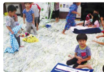
「お泊り保育」は年長さんのお楽しみ

各園それぞれ特色ある学習や行事があります。自立心を育てるお泊り保育体験や、お遊戯会を県立音楽堂で行うなど、子どもたちだけでなく、保護者も楽しみの行事がたくさんあります。