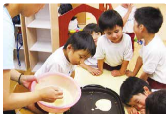
お迎えを待つ時間も楽しく

既定の時間よりも長く、朝と夕方にお子さんをお預かってくれます。ホットプレートで一緒におやつを作るなど、家庭に近い雰囲気でお迎えまでの時間を過ごしています。