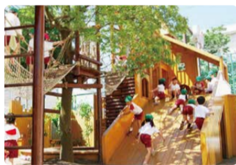
「めいろハウス」は子どもたちに大人気

太陽の下でのびのび遊べます。かくれ部屋があるオリジナル遊具があったり、園庭を裸足で駆け回ったりなど、子どもたちが楽しく過ごしています。