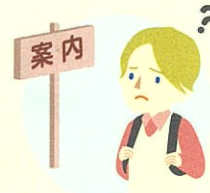
日本語の理解が十分でない外国人

そのほか、現在、支援が必要ないという方も、災害によりケガをするなど、誰もが、支援が必要になる可能性があります。