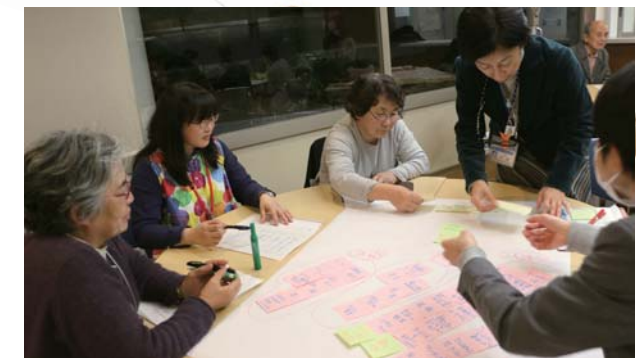
ワークショップ(イメージ)