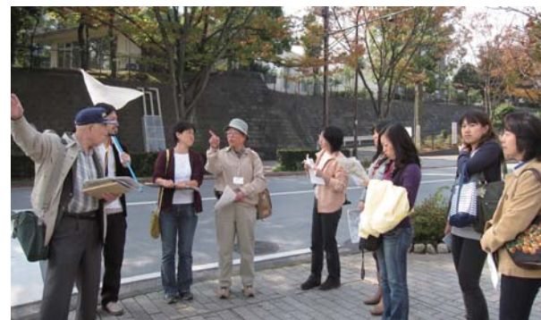
まち歩き(イメージ)