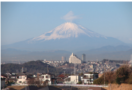
[ 小菅ヶ谷地区 ] ④ 小菅ヶ谷北公園