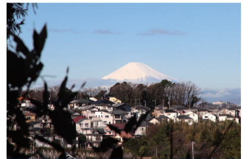
[ 上郷西地区 ] ⑦ 尾月～上郷市民の森