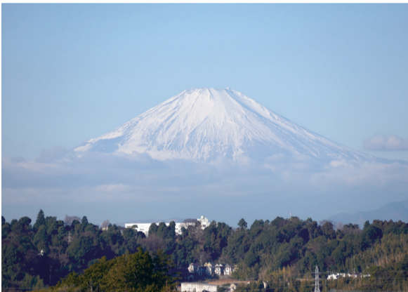
[ 豊田地区 ] ② 本郷台三丁目公園