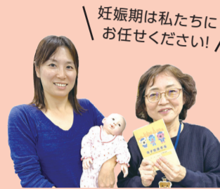
母子保健コーディネーター

赤ちゃんを迎えるにあたって必要なサポートなど、一人ひとりに合わせてお話しさせていただきます。時間に余裕をもってお越しください。