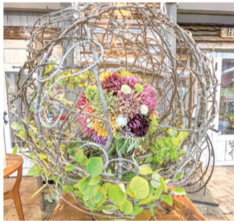
トピアリーボール

GREEN×EXPO 2027の開催に向けて、栄区の花「キク」、栄区の木「サクラ」「カツラ」を使って、花や緑を身近に感じられるオブジェ(トピアリーボール)を制作しました。区役所本館1階で展示しています。お立ち寄りの際はぜひご覧ください。