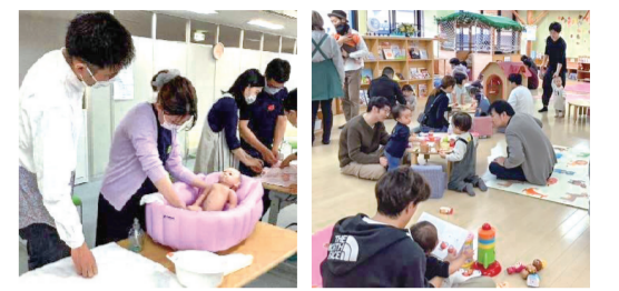
プレママ・プレパパの会 親子で遊べるスペース

「にこりんく」とは、就学前の子どもとその保護者が安心して過ごせる居場所です。広いスペースのひろばにはおもちゃがいっぱい。様々なプログラムを行っており、子育て相談もできます。パパの利用やプレママ・プレパパの利用も多くなっています。お気軽に遊びに来てください!