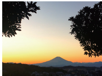
[ 本郷中央地区 ] ⑤ 公田町団地