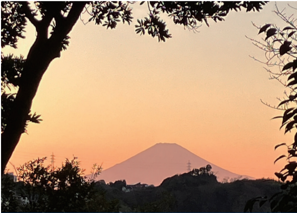
[ 笠間地区 ] ① 青木神社

新年、あけましておめでとうございませう。 冬休みはちよつと遠出…それもいいけれど、 栄区内を散歩してみるのはいかがが？ 区内から見える富士山もとてもきれいですよ。 今年も栄区がもつとすきになる一年になるかも。