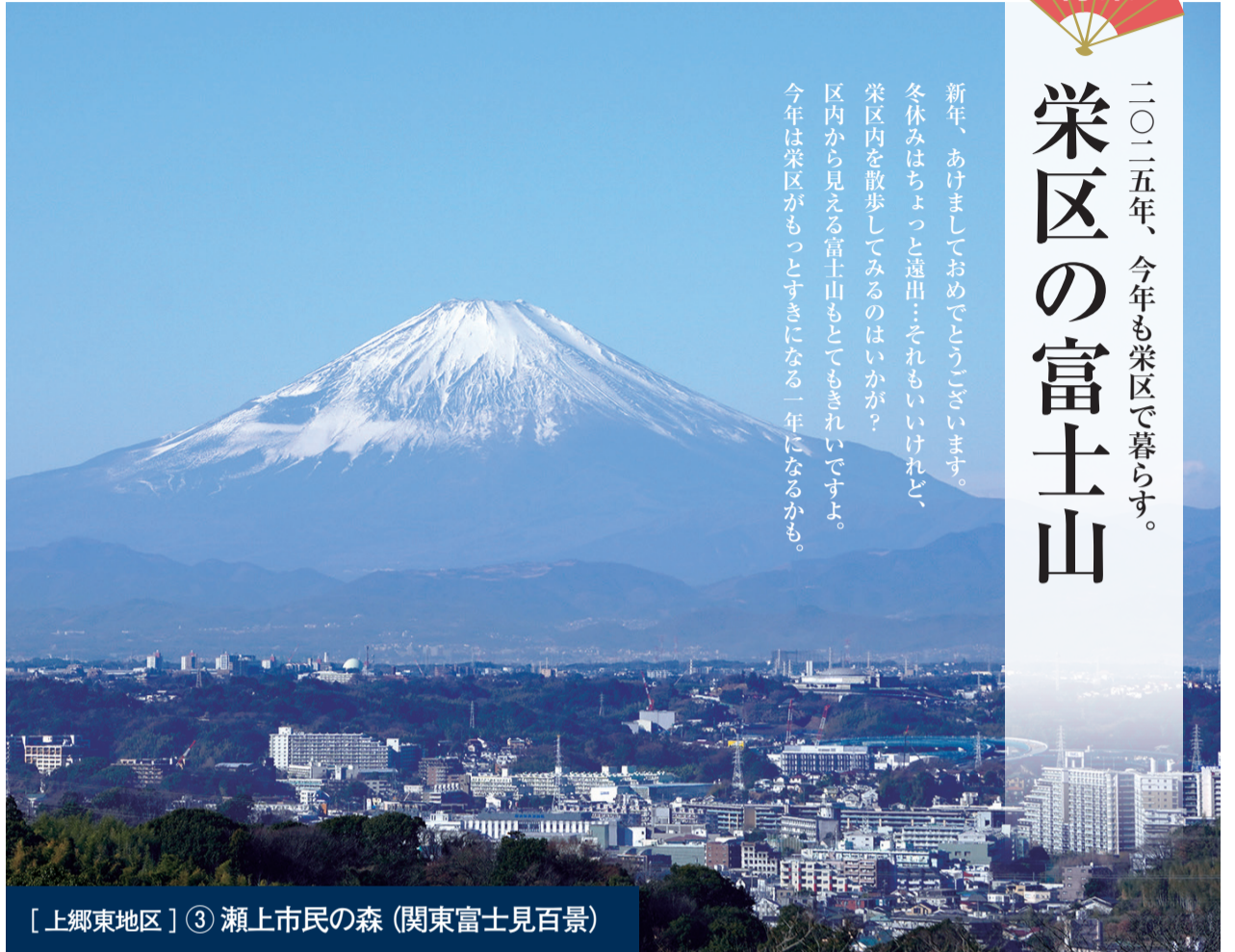
[ 上郷東地区 ] ③ 瀬上市民の森 (関東富士見百景)