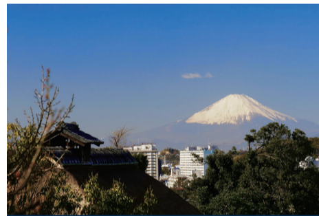
[ 本郷第三地区 ] ⑥ 本郷ふじやま公園