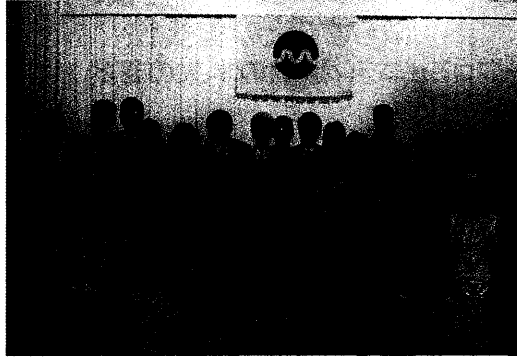
2012.8.3 横浜市栄区SC傷害サーベイランス分科会 反町吉秀(大妻女子大学)