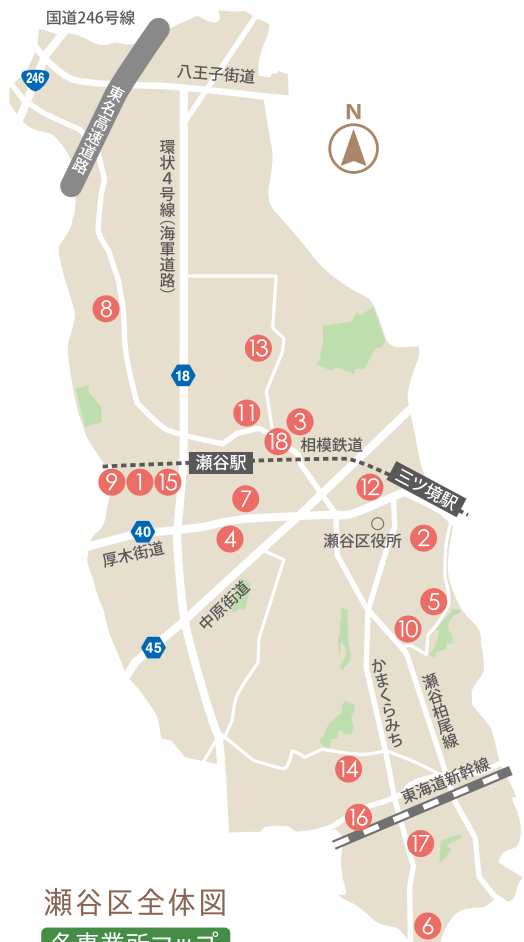
瀬谷区全体図 各事業所マップ