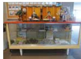
④阿久和地域ケアプラザ内