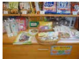
⑦カワセ薬局ふたつ橋店内