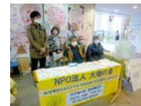
① 瀬谷区役所2階区民ホール

(瀬谷区役所福祉事業所バザー) [開催日] 毎月第2火曜日 / 11時から13時まで