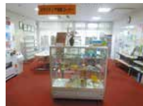
②セやまるふれあい館2階 交流ラウンジ内