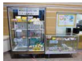
③瀬谷スポーツセンター 喫茶なごみ内