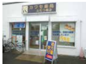
⑦カワセ薬局ふたつ橋店